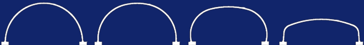
Normaali kaari SC...SA